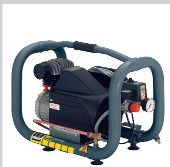
Kompaktní 10+Master – přenosný pro stavbu.

Nejsilnější kompresory ve své třídě. V technice stlačeného vzduchu pro špičkový výkon při vysoké mobilitě kompresoru.